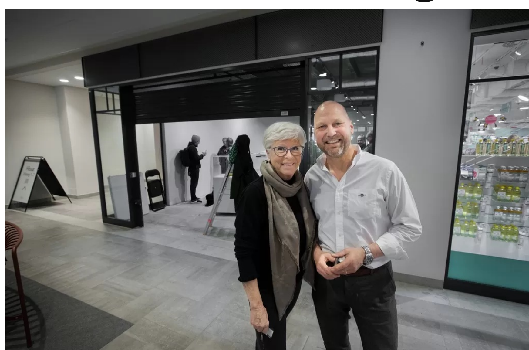
Konstnärsförening i Danderyd får ny lokal i Mörby centrum

PUBLICERAD 2024-05-10 16:09 UPPDATERAD 2024-05-13 09:43